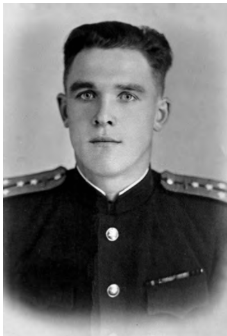
7 ноября 1948 года