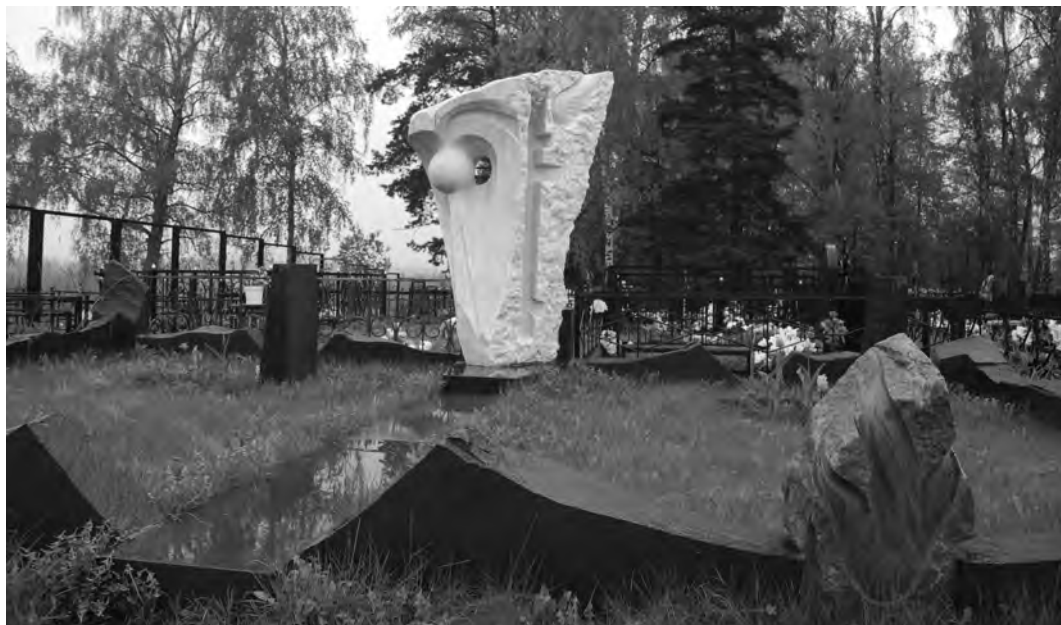
Надгробие М. В. Марначева, работа скульптора С. С. Казанцева

рядом с братом Иваном. Семейное захоронение обрамлено гранитными сколами и завершено сложной пластической композицией в виде сквозного православного креста и ядра – символа творческой души. Автор скульптурой работы – С. С. Казанцев. На памятнике надпись: «О нас не печальтесь...»