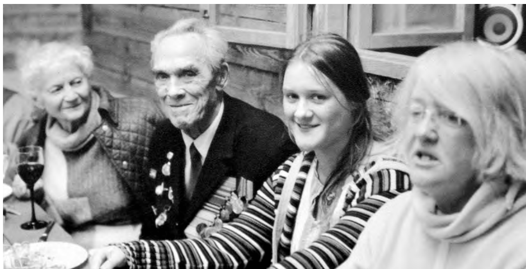
9 мая 2004 года