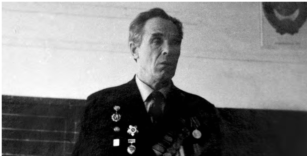
Выступление перед школьниками. 1980-е годы