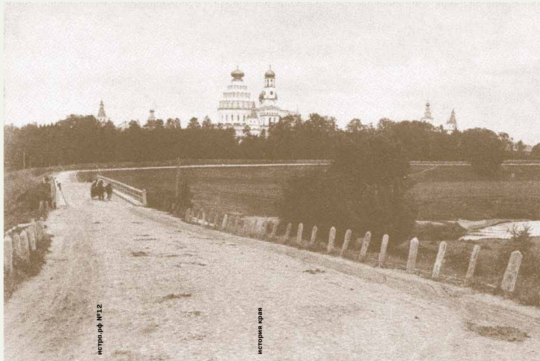
истра.рф №1 2