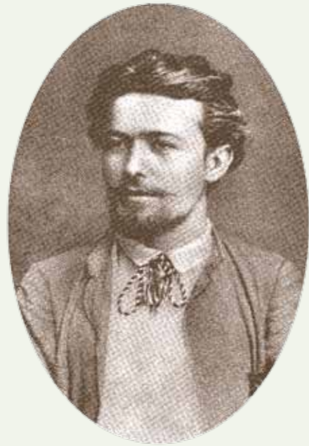
Антон Павлович Чехов

Ещё сохранились свидетельства старожилов, как Чеховы покупали молоко у Карелиных на 2-й Клинской улице