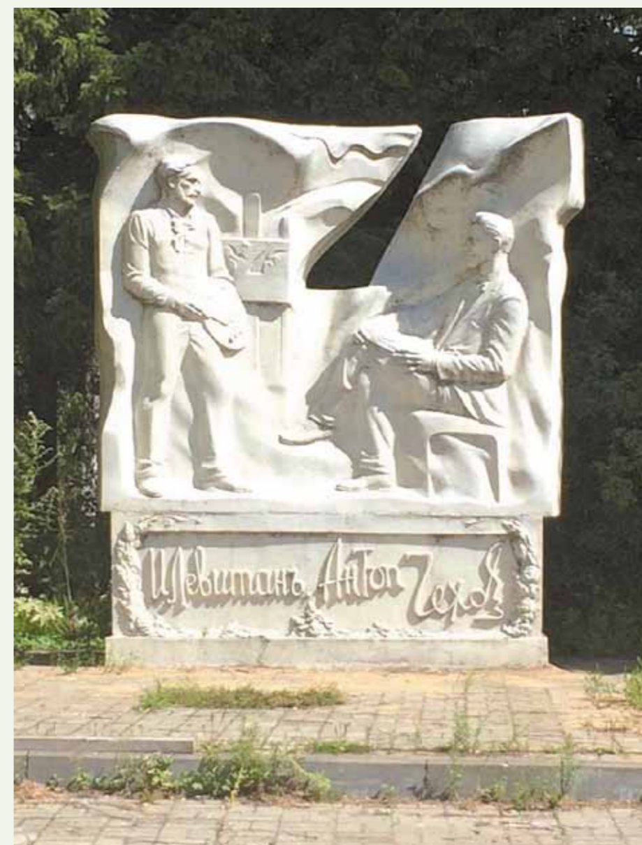
Памятник Чехову и Левитану в Бабкине. Современное фото