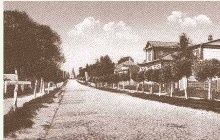
Большая Крестовская улица в Воскресенске. Начало XX века