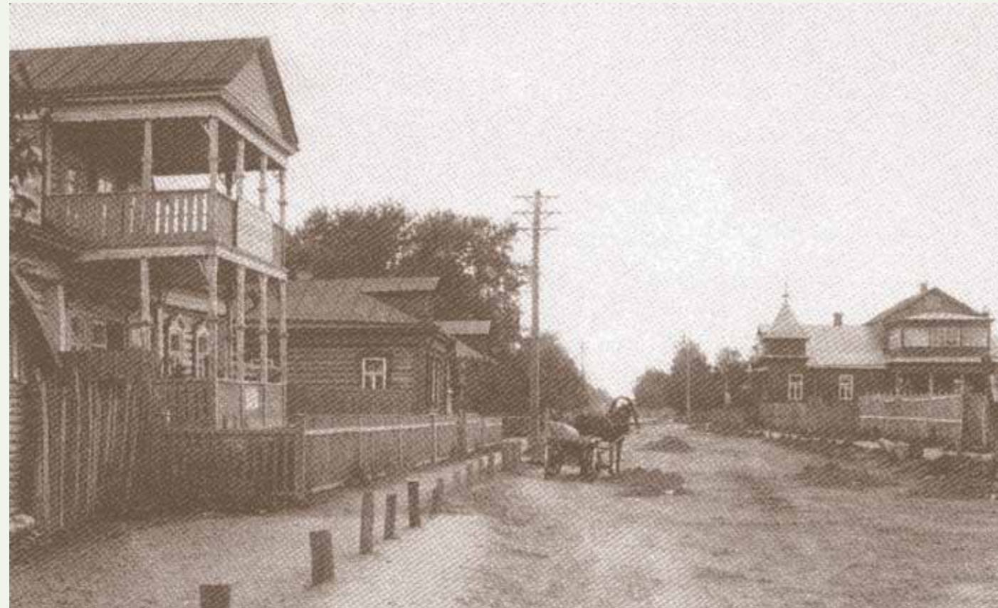
1-я Клинская улица в Воскресенске. Начало XX века

нынешняя улица Щёголева, согласно дореволюционному плану развития города, должна была получить имя великого писателя. Но случилась революция, и улице дали название в честь местного революционера, имя которого сейчас мало кто вспомнит.