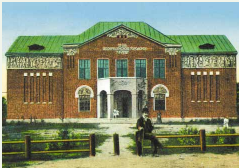
Воскресенское городское училище. Начало XX века

В 2018 году время памятник перенесли к историческому зданию Истринского драматического театра — в целях сохранения и по просьбе автора Владимира Суровцева и академика Владимира Григорьевича Яцука, выступившего меценатом при создании скульптуры.