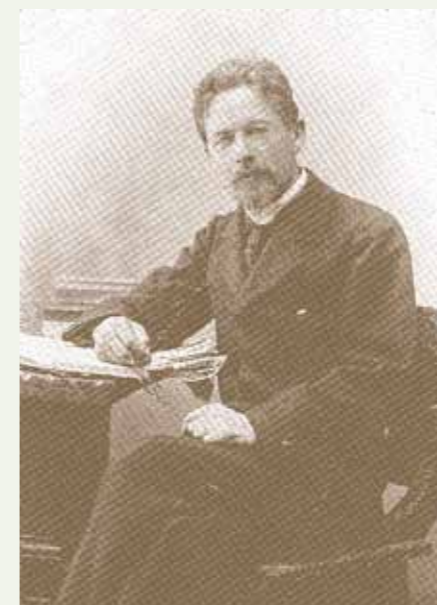
Антон Павлович Чехов

помещики, купцы. Среди прочих и сам Архангельский, избранный пожизненным почётным членом Общества.