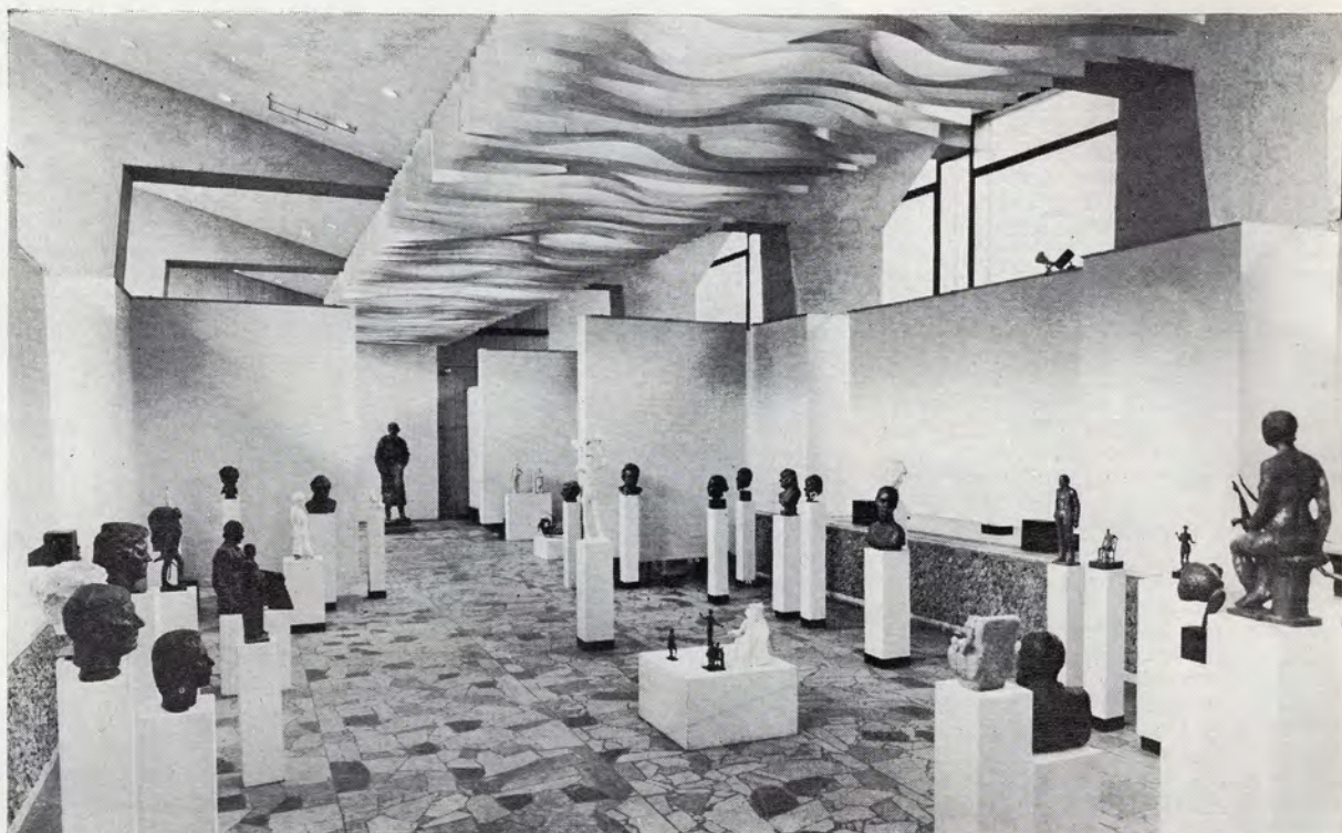
Часть экспозиции выставки скульптуры Подмосковья