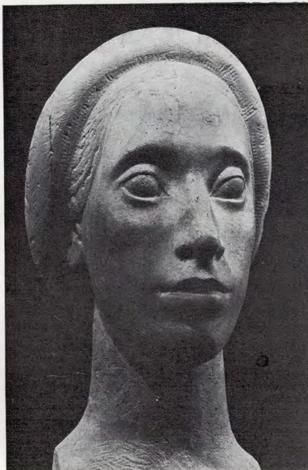
З. Романова Женский портрет 1982. Известняк

художников Подмосковья опирается не только на избранный канон, но и на сам материал. Как правило, скульпторы чутко воспринимают специфику дерева, великолепно используют его фактуру. Композиции и портреты, созданные Л. Дрок, С. Чехомовым, Т. Бусыревой, Г. Косенковым,