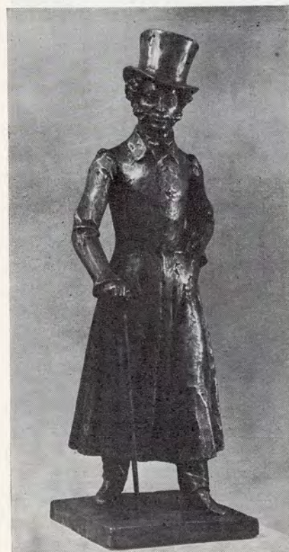
Ю. Логвин А. С. Пушкин 1982. Бронза