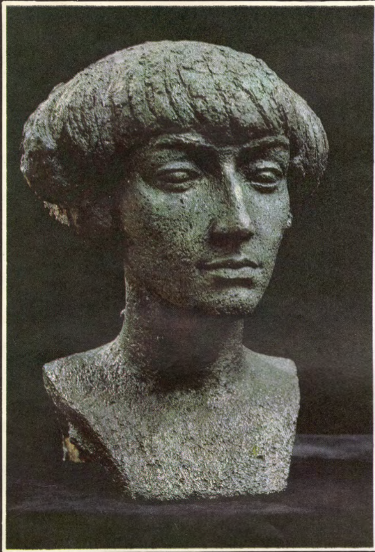
ПОРТРЕТ МАРИНЫ ЦВЕТАЕВОЙ. 1986.