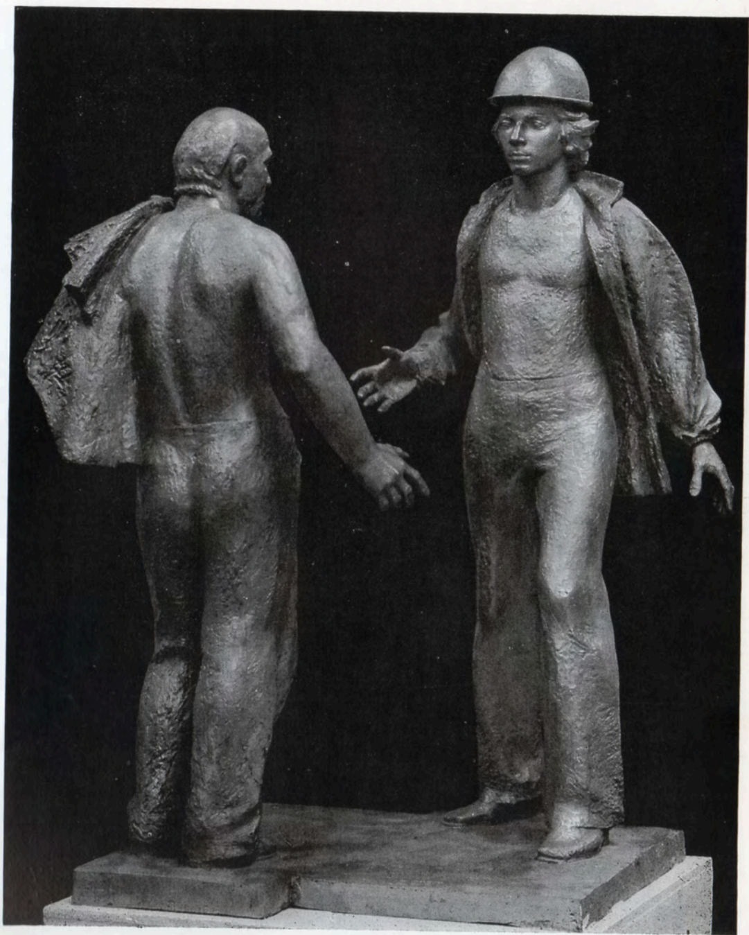
Die Arbeiterschicht (Die Ersterbauer von Komsomolsk/Amur), 1982, Bronze