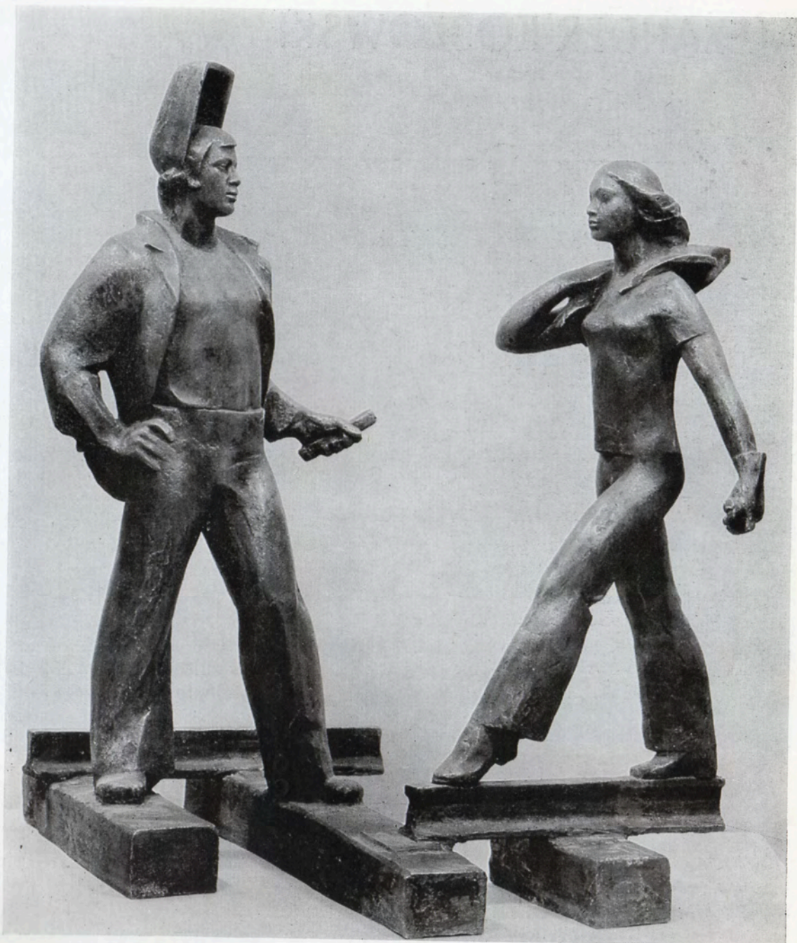
Jugend der BAM, 1982, Metall