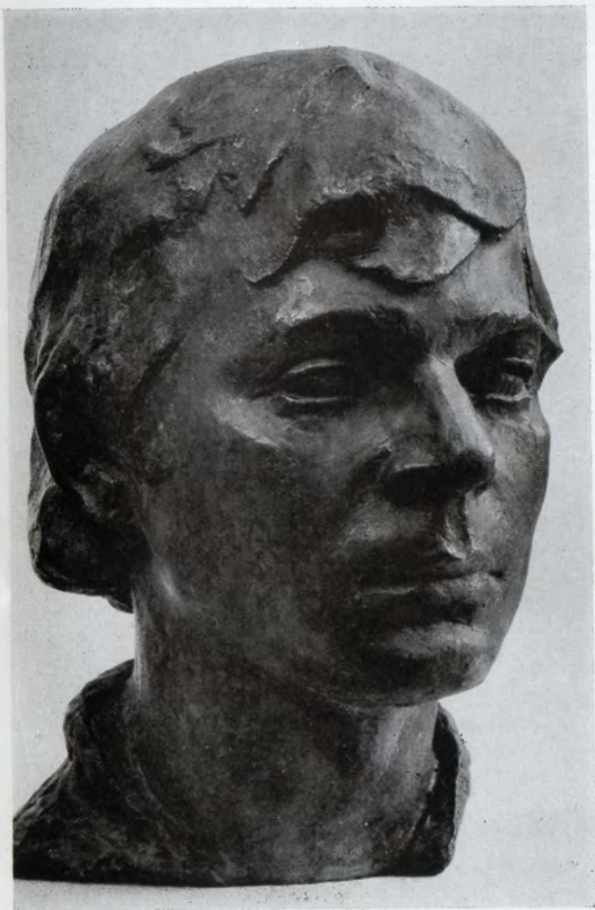
Der Bestarbeiter, Schlosser des Schiffbauwerkes „Der Leninkomsomol“ (Komsomolsk/Amur), 1982, Bronze